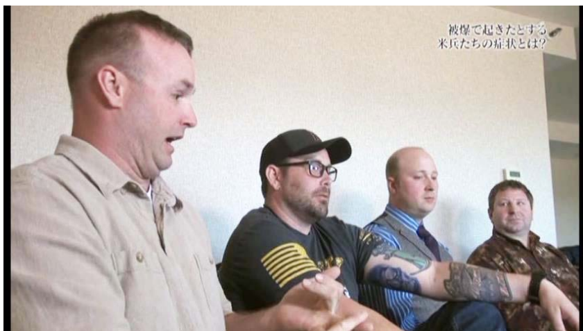
写真は、被ばくの症状を語る元水兵たち

●福島原発事故のとき、救援に入ったアメリカの空母が福島沖約240キロで放射性プルームに覆われました。乗組員多数に、広島・長崎と酷似した症状が出て、すでに9名が死亡しています。この事実を、NNNドキュメントが昨年10月に報じました。