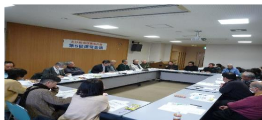
運営会議でもたくさんの知恵が出され