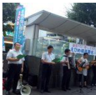
(松山市駅前街頭署名行動)

また各地区の「署名集中アクション」が今までにない広がりをつくっていますし、呼びかけ人の中には一人で100筆200筆と集める人も生まれ、団体によってはすでに5,000筆を超える署名を集約したところも生まれています。いよいよ2月には署名集約のピッチを上げなければなりません。呼びかけ人お一人おひとりが、また各団体のみなさんが思い切って署名を広げていきましょう。