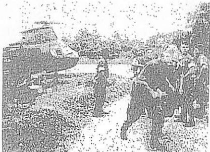
【伊方・墜落現場】 伊方町見農協の入り口付近に墜落した米軍のヘリコプター。本館記者は、現場には米軍以外はいないが、伊方の警察が阻止を強めて、伊方町見農協も伊方の町見入り口付近に

でも、今なお墜落の恐怖は語られているが、サタンの火と呼ばれる原発は、そうした地元民の悲鳴をも飲み込んでチェルノブイリの悪夢を高め続けている。