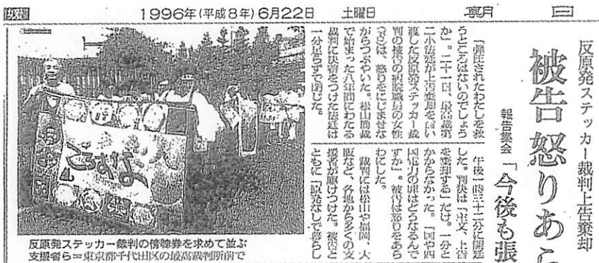
反原発ステッカー裁判の傍聴券を求めて並ぶ支援者ら＝東京都千代田区の高松裁判所前で