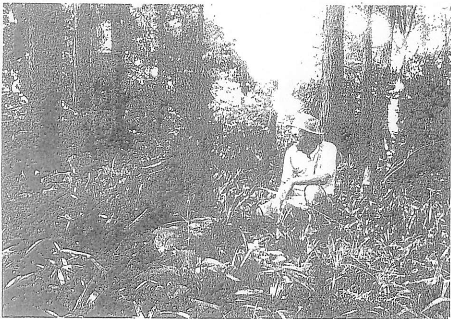
ヘリコプター墜落現場を検証する筆者 (1988. 8. 28)