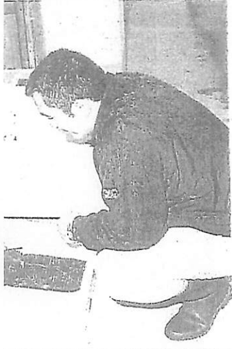
小雨の中、緑広がる麦畑の雑草を取る農家の人 —19日、温泉郡重信町

海七漁協に無償配布した。県水試が本格的にアコヤ貝の稚員を量産し、配布したのは初めて。量産配布は三年間継続し、県水試は配布した員が真珠を生み出すまでを追跡調査する。 配布した員の親貝は、真珠層の主成分・炭酸カルシウムを作る「炭酸脱水素酵素」の含有量や栄養・血液の状態、赤変化度合いなどを基準に天然日本員と日本産中国員から選抜。二月下旬、育てていた。