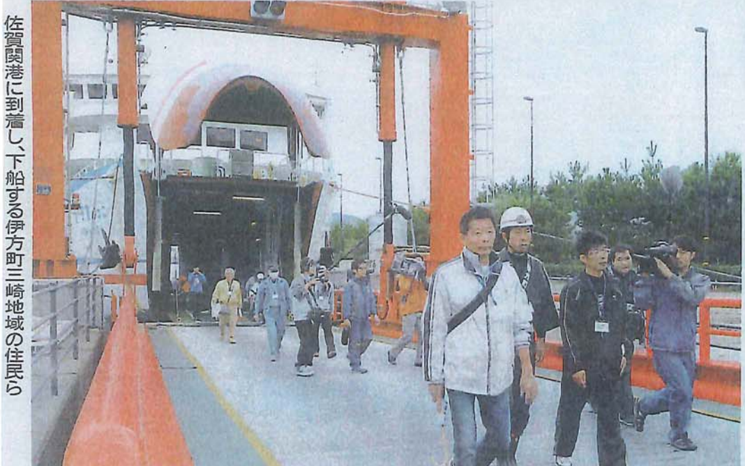
佐賀関港に到着し、下船する伊方町三崎地域の住民ら