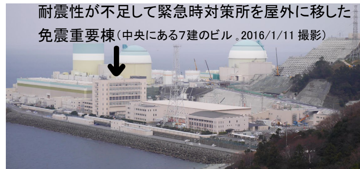
耐震性が不足して緊急時対策所を屋外に移した 免震重要棟(中央にある7建のビル。2016/1/11撮影)

再稼働せず廃炉にさせる上でも事故への対策は不可欠です。事故対策を縮小して危険を増大させるなど許されません。伊方原発の再稼働など、とんでもありません。