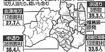
福島県の子どもの甲状腺がん発生率(暫定値)

東京電力 福島第一 原発事故の被曝(ひばく)による子どもの甲状腺への影響を調べている 福島県 の検査で、受診した約30万人のうち104人が甲状腺がんやその疑いと判定されたことがわかった。県は「被曝の影響とは考えにくい」としている。この結果は24日に公表される。